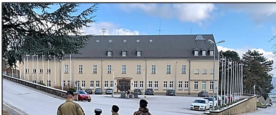
Caserne de Diekirch