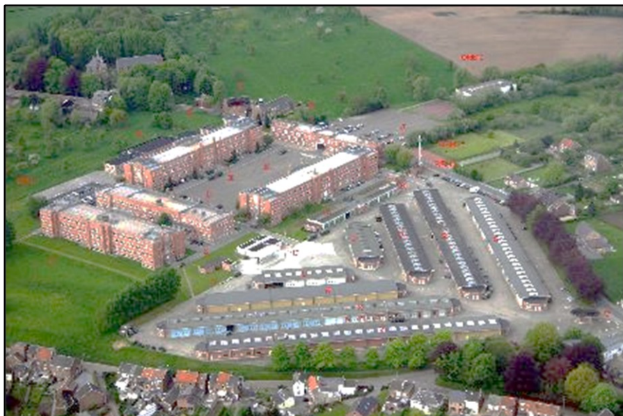
La caserne de Saive en 1992

1932 : renforcement de la PFL (Position Fortifiée de Liège*) et décision de l'édification d'un nouveau quartier militaire à Saive, dans l'intervalle entre les forts de Barchon et Evégnée.