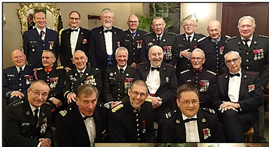
Ambiance 2022 – Participants et partici- pantes.