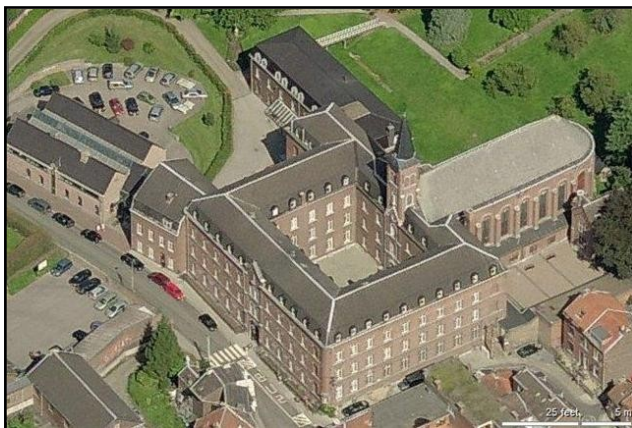
le Collège Saint François d'Assise