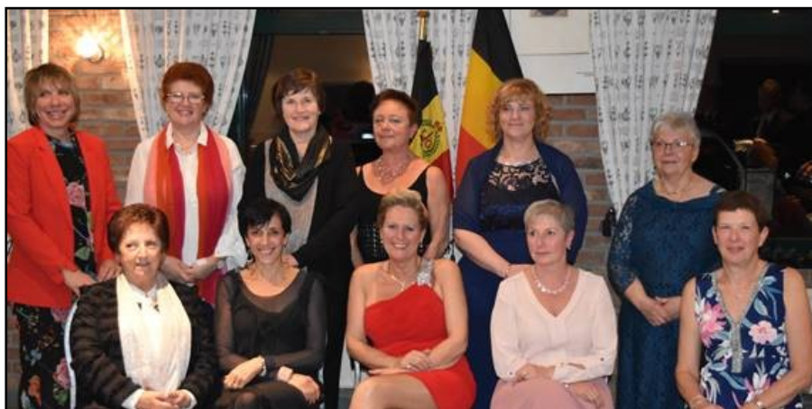
L'assemblée des dames