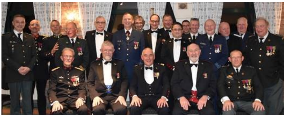
L'assemblée des messieurs

Voici un petit reportage photographique de la soirée.