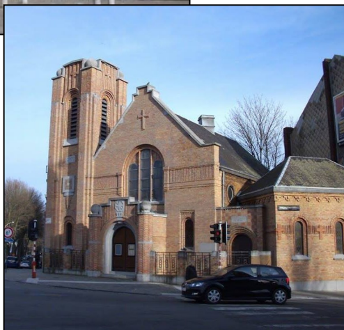
Le temple protestant

Un avant-goût .... quelques mots à propos du Balloir :