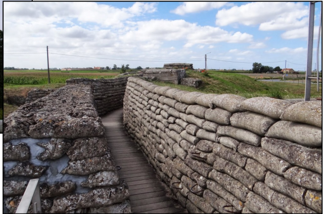
Tranchée de liaison dite « de la borne 16 à l'Yser »

L'année 2018 verra s'organiser un peu partout, en Belgique des manifestations célébrant la fin de la Première Guerre mondiale.