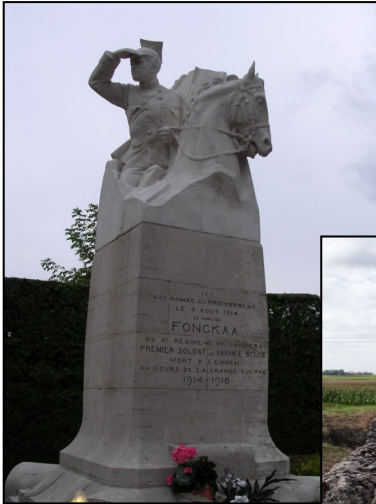
Le cavalier Fonck à Thimister