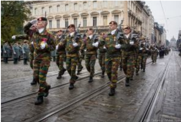
La nouvelle compagnie de réserve opérationnelle défile lors de la cérémonie du 11 novembre

Extrait de « À l'Avant-Garde : Site d'actualités sur la Défense belge » – https://defencebelgium.com/