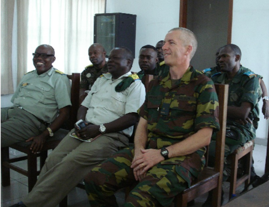
Séminaire à nos collègues congolais

Durant notre excursion dans le lit du fleuve, nous aurons l'occasion de voir les carrières de la saison sèche. Taille des rochers du fleuve à la masse, de la pierre de construction au gravier de parterre, mais aussi des sabliers (pour le béton), une mère qui vient faire son linge avec ses deux enfants, un pêcheur qui tente d'attraper quelque poisson (peu évident à la saison sèche). Et même si c'est dimanche, le Congolais s'affaire. Seuls ceux qui sont employés dans des entreprises ou à l'administration ont du temps libre (excursion au bord du fleuve, fête de famille,...). En général, le rythme de travail congolais est 6jours/1jour.