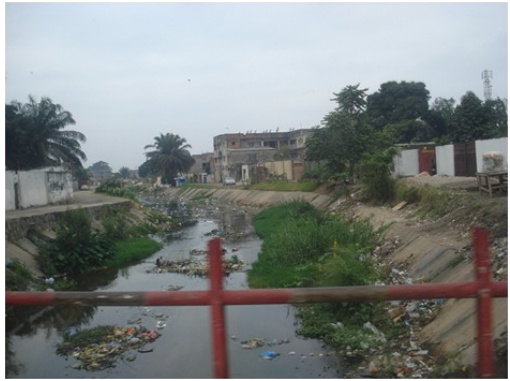
Un ruisseau à travers la ville

Un moment crucial sur le plan financier pour les Kinnois (même problème pour tous les parents à cette époque de l'année) : La rentrée des classes (en fonction de l'école et/ou de la filière suivie) pour laquelle il faut déboursier pour l'inscription à l'école (minerval de la gardienne à l'université), mais aussi le matériel scolaire nécessaire (pour notre chauffeur par exemple, un peu plus d'un mois de salaire – « à la louche »). Dans les écoles supérieures, les travaux pratiques s'achètent (donc celui qui n'a pas d'argent ne sait pas correctement apprendre).