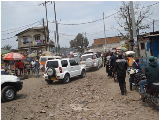
Dimanche matin dans les faubourgs de Kinshasa

Le plus relevant ici à Kinshasa (comme dans des grandes mégapoles de ce type), c'est la pollution. Rares sont les Occidentaux qui ne sont pas dérangés soit par la climatisation et/ou soit par la (non-)