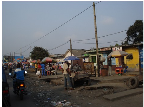
Les échoppes de rue

moyen est le minibus, le bus ou la moto-taxi... Chaque parcours en minibus (qui après l'utilisation de ses jambes... reste le moins cher) coûte 500 francs congolais (environ 1/2 dollar). L'évolution du trajet est tributaire du moment de la journée et de la densité du trafic. Le chauffeur qui nous avait été attribué les deux premières semaines devait quitter chez lui à 5h du matin pour être à 7h30 à notre hôtel afin que nous puissions arriver à 8h00 à l'école. Son salaire mensuel oscille dans la fourchette 200 à 250 dollars par mois (ce qui est loin d'être un mauvais salaire ici; le salaire de base d'un officier étant légèrement supérieur à 100 dollars – se complétant par des primes pas toujours réparties dans un esprit logique) Le chauffeur que nous avions été titulaire à notre Ambassade et donc payé