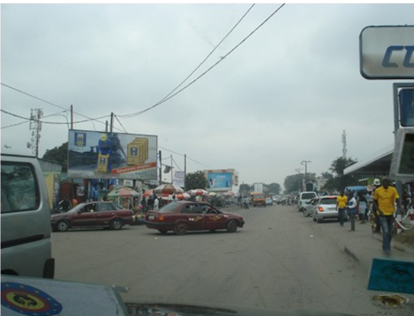
Le carrefour à proximité de l'ECM un samedi midi

Les deux contingents qui nous ont précédés ont accompagné la 25 ème Promotion (respectivement en automne et à la fin de l'hiver). Notre but ici, notre présence se limitant à une douzaine de semaines sur un cursus qui dure six mois pour les stagiaires, n'est forcément pas de donner cours à la place du corps professoral, mais bien de les épauler, les accompagner, les coacher, les conseiller dans le suivi et pour la suite du développement de l'écolage des stagiaires. Il faut dire que la crise qui a secoué le pays en 1991 a mis à rien une grande partie de l'infrastructure et des institutions. La reconstruction est lente, très/