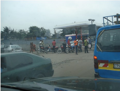
L'arrêt des motos-taxis à côté de l'école militaire