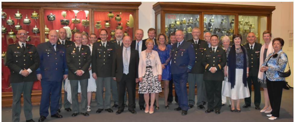
Le cercle de Liège a été représenté en force à la réception du 80 e anniversaire de l'URNOR qui s'est tenue le 10 juin dernier au Musée de l'Armée