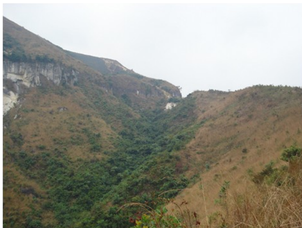
A quelques kilomètres de Kinshasa, chemin de croix du Sacré Cœur.

Les jours suivants, je passerai à l'Ambassade et aurai mes premiers contacts avec mon futur lieu de travail (l'Ecole de Commandement et d'Etat-Major des FARDC – Forces Armées de la République Démocratique du Congo - à Kinshasa). Du point de vue sécurité, le maître-mot reste prudence sur tous les plans : Kinshasa est une mégapole où le plus grand souci des habitants est l'argent car c'est grâce à lui qu'ils peuvent vivre... Sachant que le plus grand outil de communication ici est « radio trottoir » et tenant compte du fait que le blanc est considéré comme « riche »,