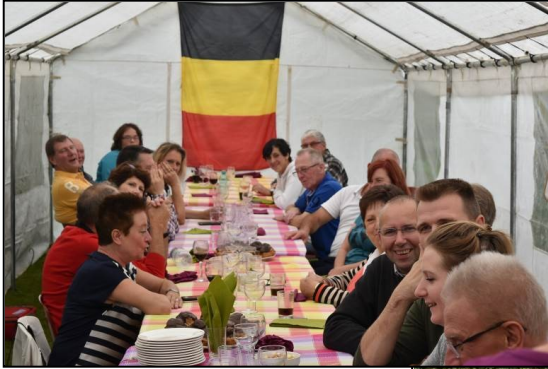
Le BBQ des familles qui eut lieu chez le Président le 13 septembre rassembla une trentaine de participants.