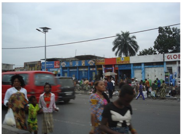
Premier contact avec Kinshasa

Après avoir fait le replein (système de citerne souterrain), l'avion ira se parquer devant le terminal militaire : Sur la pelouse, six à sept cou-