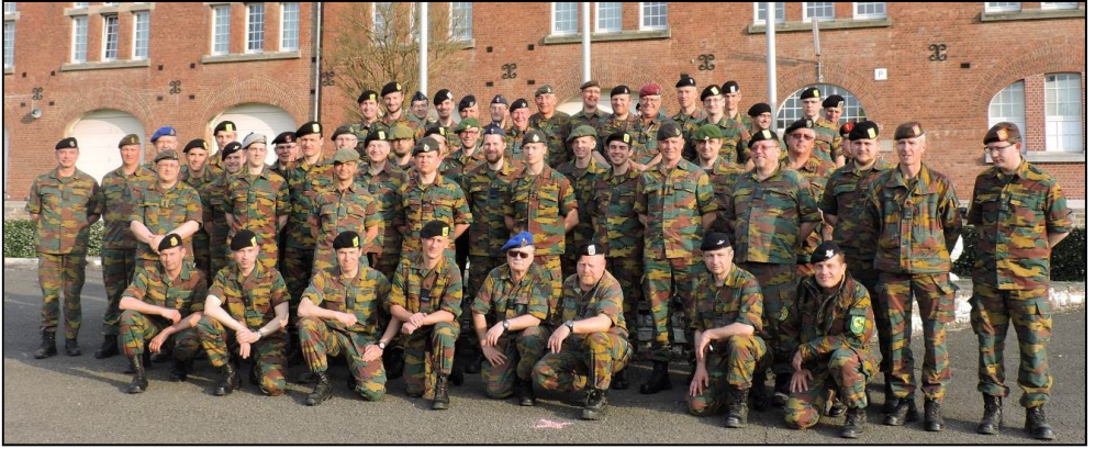
Tous les participants à la journée de formation continue pour « jeunes réservistes » le vendredi 24 avril 2015 à Spa