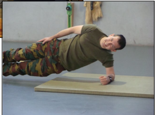
Stand EPS avec le fameux Left & Right Side Bridge