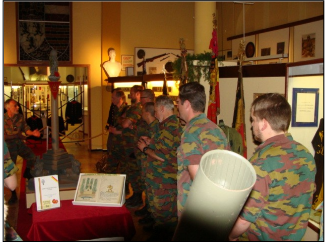
Visite du musée du 12/13 Li

Après la visite du musée, tous se rassemblent à la salle de cinéma pour l'habituel débriefing d'activité. A l'issue de cette ultime activité, nous avons pris en commun « un repas amélioré » au ménage du 12/13 Li, bien venu après cette longue journée au grand air.