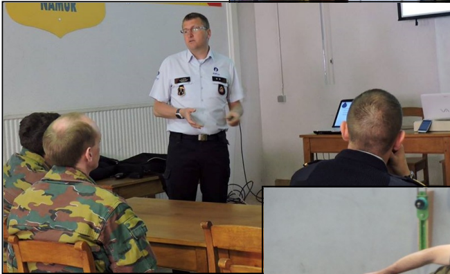
Stand de la Police fédérale