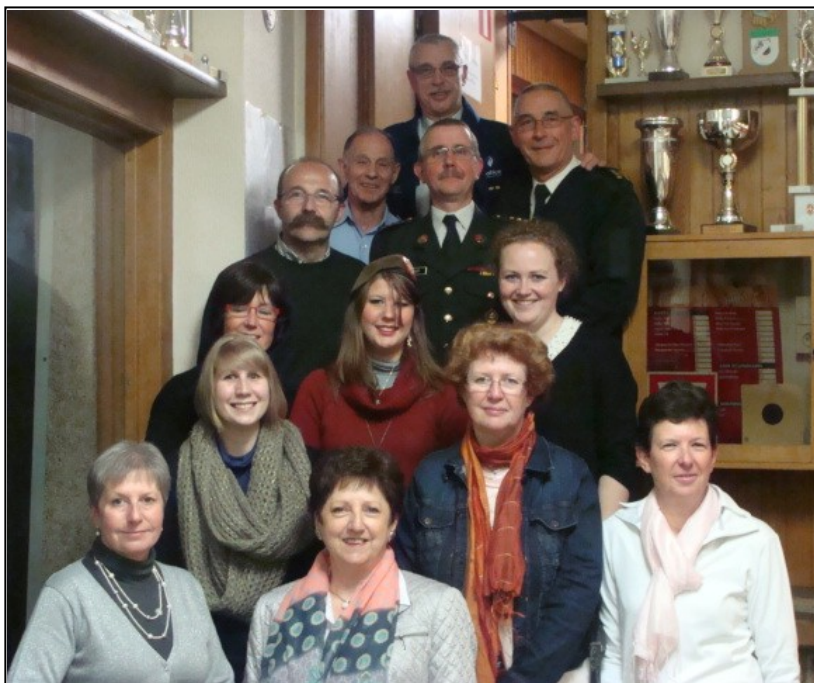
Les participantes et les organisateurs.