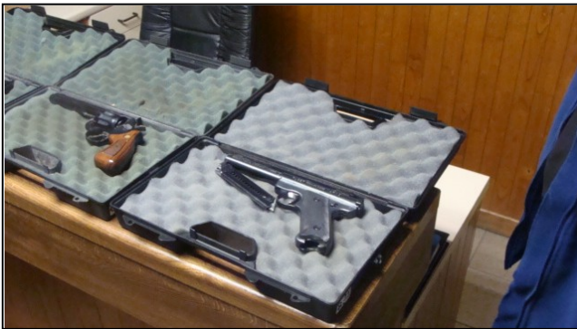
Les armes (pistolet et revolver)

En voici un petit « reportage » en images.