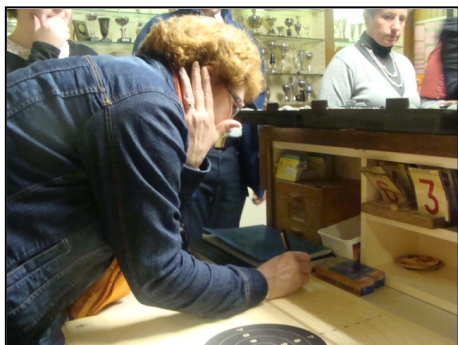
La préparation des cibles