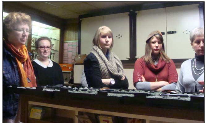
Le briefing de sécurité