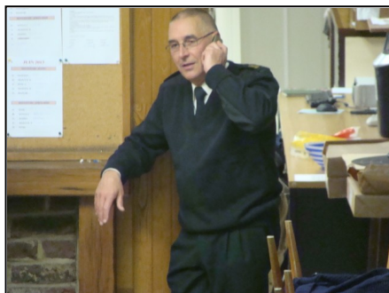
Le Président et le Vice-Président sont satisfaits