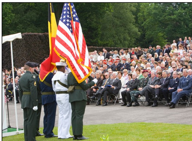
Memorial Day – mai 2008

Nous vous y attendrons le samedi 23 mai 2009.