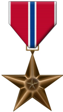
Bronze Star Medal