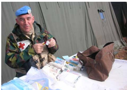
Contrôle du matériel avant le départ vers un appui

les autres militaires UNIFIL déployés dans la région (français – italiens – espagnols – ghanéens – libanais, ....). Enfin, des soins sont prodigués à la population locale dans les cas d'urgence.