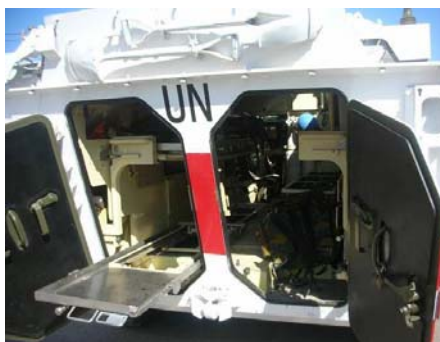
PANDUR Ambulance : le fleuron du système d'évacuation en terrain difficile

C'est vers 07 heures qu'a lieu le réveil des patients hospitalisés au holding où 20 lits permettent à chacun de se refaire une santé. Le service d'hôtellerie se fait en chambre, comme dans un hôpital belge.