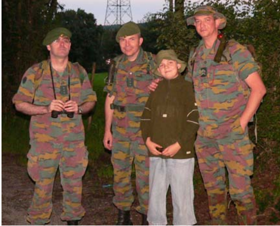
Prêts pour le départ !

marche à l'azimut, un gisement à convertir en azimut, un calque muet qui donnait un itinéraire à suivre.