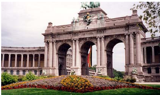
(Arches du Musée Royal des Armées à Bruxelles)

Un lieu ou un établissement où est conservée, exposée, mise en valeur une collection d'œuvres d'art, d'objets d'intérêt culturel, scientifique ou technique, telle est la définition d'un musée.