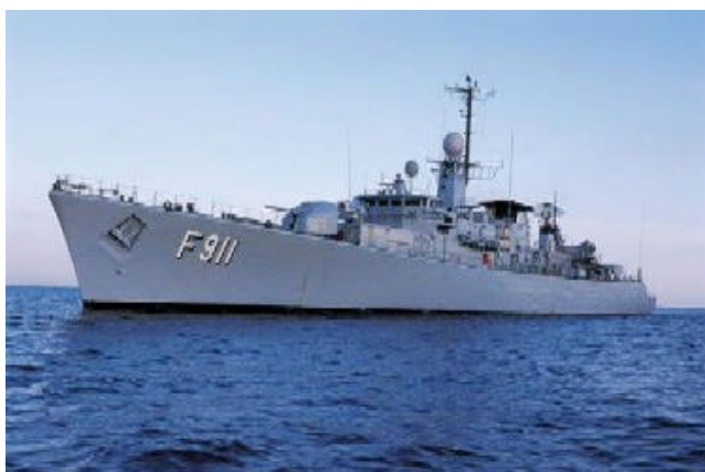
Frégate F911 Westdiep