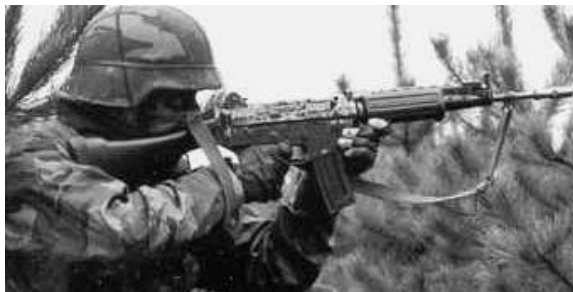
Entraînement au tir avec le fusil FNC

L'armée belge a adopté le système en 2003 et l'armée française conduit actuellement des évaluations à l'Ecole d'Application de l'Infanterie en vue d'une adoption future.