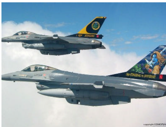
F16 en patrouille

Afin de permettre de répondre efficacement aux nouveaux challenges imposés par l'évolution de la situation géopolitique, le 15 Wing de Transports Aériens (entre autres les C130) évoluera vers une composition joint qui permettra des opérations 7 jours sur 7 et 24 heures sur 24.